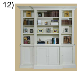
bookcase or shelves