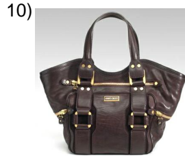
the bag, purse