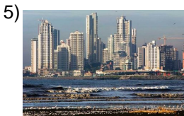
bigger and bigger