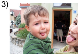
at the same time