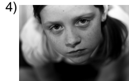
as it once