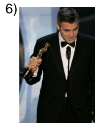
better and better