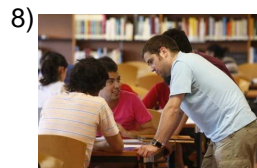
from bad to worse