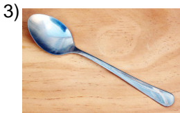
dessert spoon _____