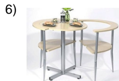
the little table _____