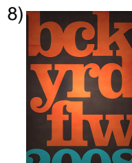
bold (computer) _____