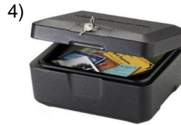
security box _____