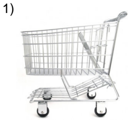
shopping cart _____

Words to Match: carrito de compras - cucharita - el carrito de equipaje - rejilla de ventilación - la mariquita (catarina) - mesita de noche - la mesita - cajilla de seguridad - la casita de muñecas - perrito caliente - el bocadito de crema - negrita - caballito de mar - el bocadillo