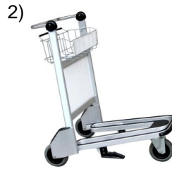
luggage cart _____