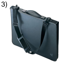
purse, pocket-book, portfolio