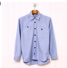
formal dress shirt