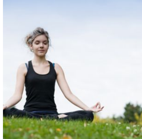
I feel very good